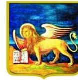
REGIONE DEL VENETO

Fondo europeo agricolo per lo sviluppo rurale: l'Europa investe nelle zone rurali